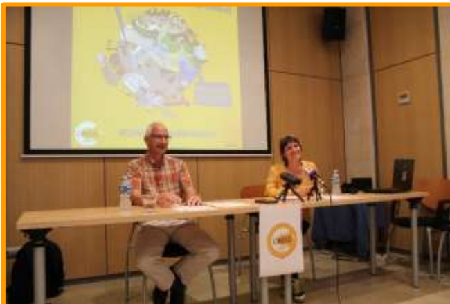
Imagen 3: Presentación de la campaña

Presentación del PNL: https://congrib.org