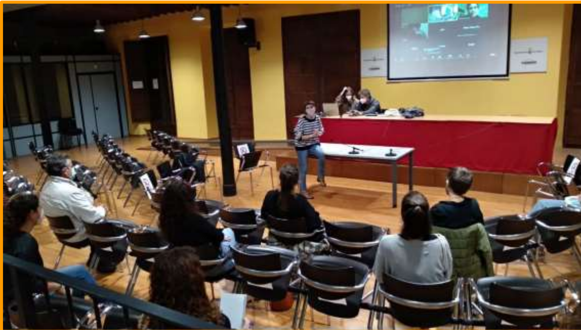
Imagen 5: Cinefórum "Els temps que resta"