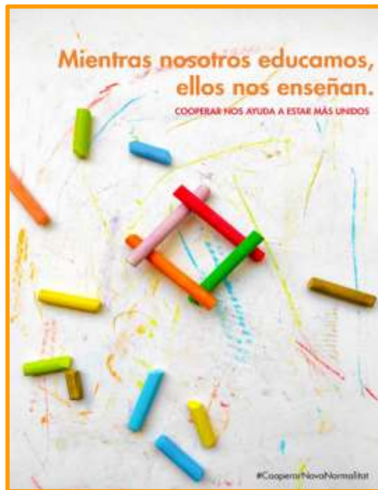
Imagen 4: Diseños realizados por el alumnado