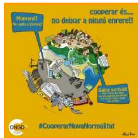
Imagen 2: Diseño de la campaña