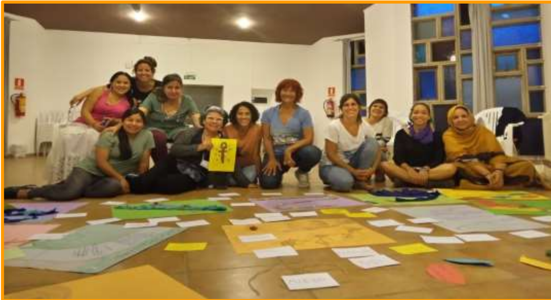
Imagen 1: Encuentro de mujeres en Lluc

transformadora en relación a sus historias de vida (guerras, violencias machistas, criminalidades coloniales) y las aportaciones de los feminismos decoloniales.