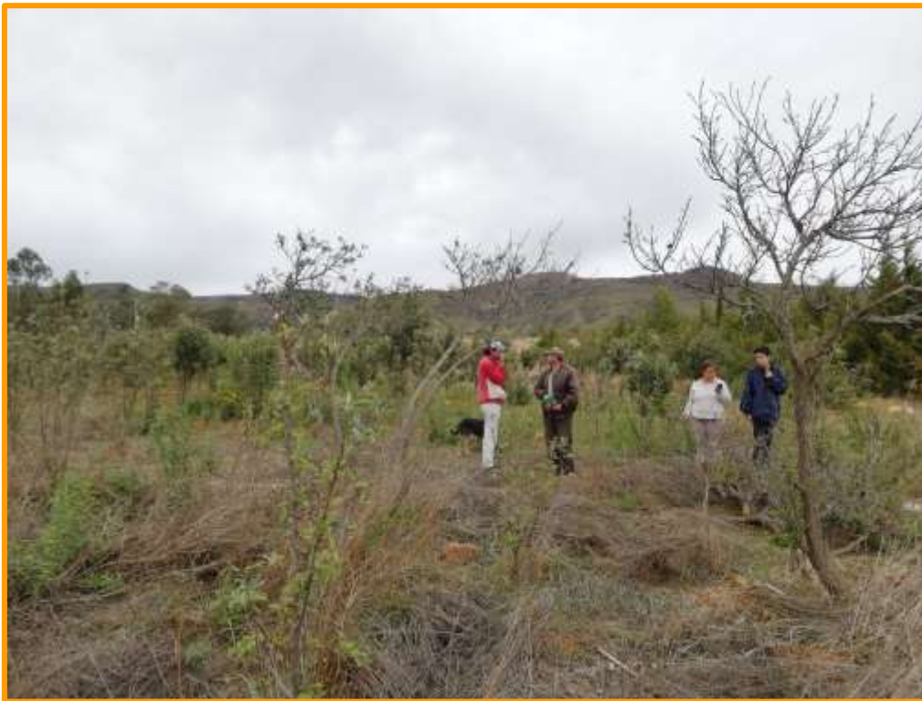
Imagen 6: visita a frutales