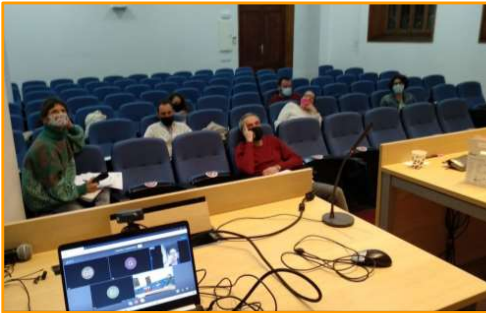
Imagen 3: Tertulia sobre modelos de cooperativas