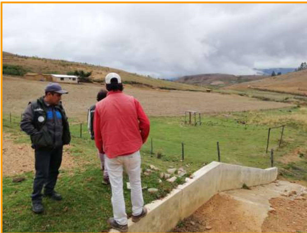
Imagen 5: vista de una de las obras de aprovechamiento de agua

Por otra parte, uno de nuestros voluntarios ha viajado el pasado noviembre a Pocona para acompañar a Mosoj Causay en la evaluación de la sostenibilidad de los proyectos de aprovechamiento de agua, así como de los huertos familiares, reforestación y la rehabilitación de obras anteriores.