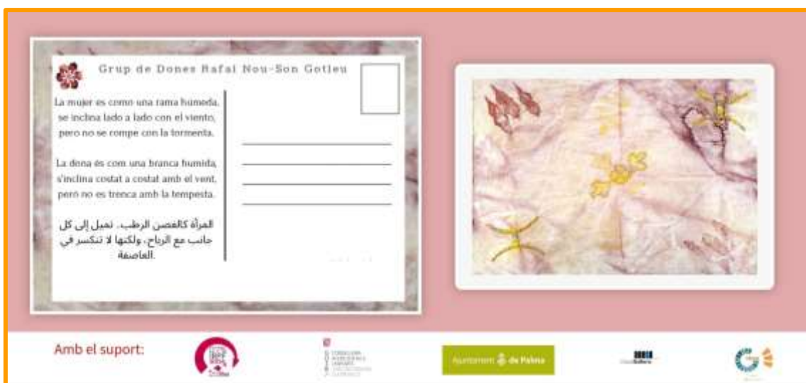
Imagen 4: diseño de postal parte del proyecto Dones, l’oli i l’art

Desde el 2017 acompañamos a un grupo de mujeres mayoritariamente musulmanas, procedentes de Marruecos y Pakistán. Con ellas trabajamos procesos de participación social para impulsar el reconocimiento de sus identidades culturales, como mujeres y como mediterráneas. Este año, junto a ellas y a la Cooperativa Jovent, se ha realizado una producción artística llamada “Les dones, l’oli i l’art” que ha concluido con una impresión de postales con frases y diseños.