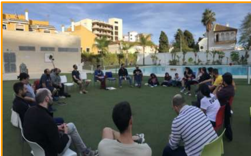
Imagen 7:cósmica 2021

Finalmente, durante la Asamblea, se han renovado cargos y ESF Balears ha cogido el cargo de la Vocalía de Comunicación federal, que llevará por un periodo de dos años.